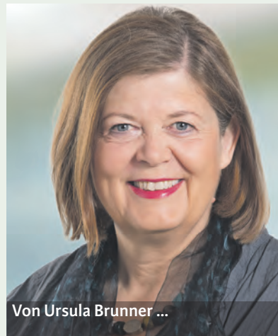
Von Ursula Brunner ...

Gemeinsam festgehalten haben die Frauen zum Abschluss, dass Frauen «sich gegenseitig fördern und sichtbar machen» müssen. Nur so kann ihre Präsenz in Verwaltungs- und Stiftungsräten weiter wachsen.